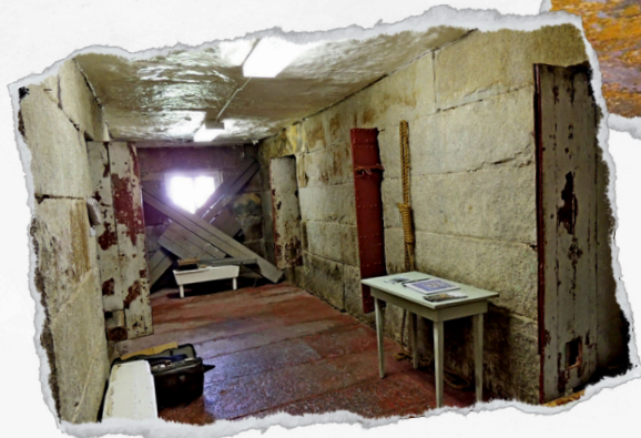
Visite guidée historique hantée