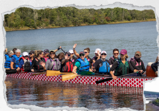
Course "Dragon Boat"