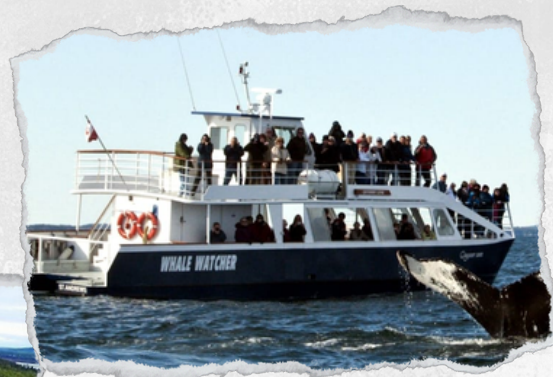
Observation de baleines